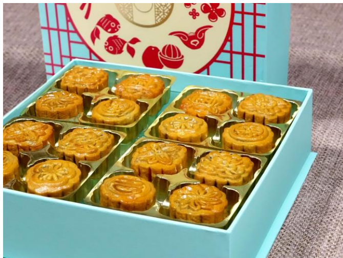
↑台湾の伝統的な月餅