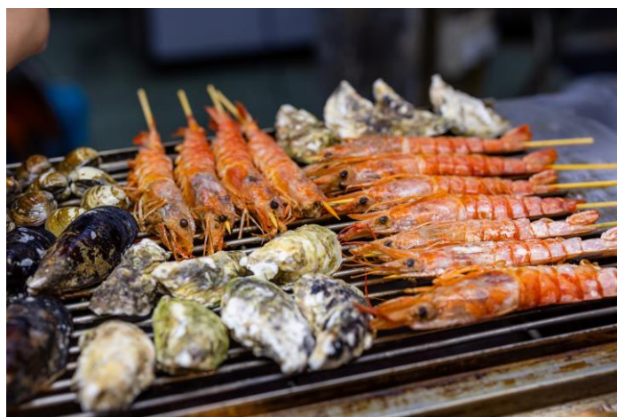
↑路上で見かけられるバーベキュー風景

・9月からは、豊作と祝賀の慣習が満ち溢れる秋の季節です。この期間、台湾の人々は家族が集まり、月餅を楽しみ、バーベキューをしながら、満月を愛でて、中秋節を祝います。また、農曆の7月にあたる中元普渡(台湾のお盆)も9月に始まり、人々は祖先を祭り、花燈フェスティバルを行ったり、伝統的な布袋戲を楽しんだりして、民間信仰の趣きを広めています。