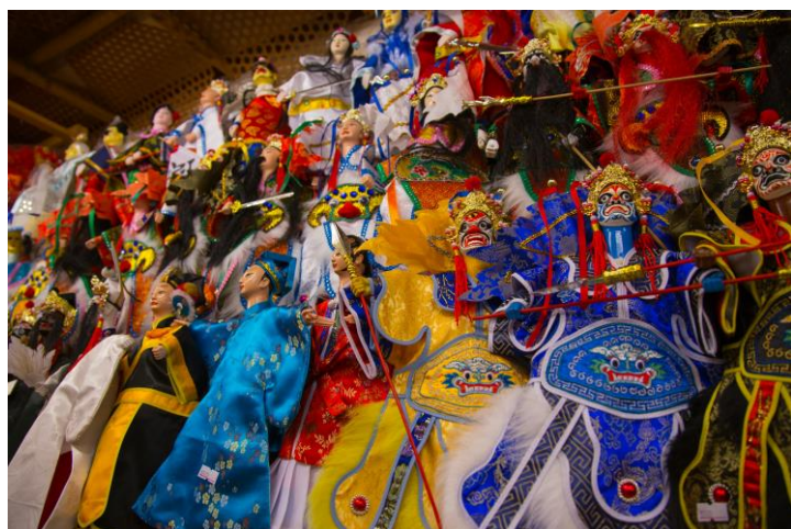
↑台湾の布袋戲人形

・10月の国慶節(10月10日)は中華民国(台湾の正式名称)の建国を記念し、国内外で様々な祝賀行事が行われます。その日は一般に休日とされ、多くの台湾人が家族や友人と共にお祝いし、国旗を掲げて祝福の気持ちを表します。