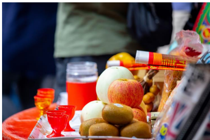
↓中元普渡時のお供え物

・10月の国慶節(10月10日)は中華民国(台湾の正式名称)の建国を記念し、国内外で様々な祝賀行事が行われます。その日は一般に休日とされ、多くの台湾人が家族や友人と共にお祝いし、国旗を掲げて祝福の気持ちを表します。